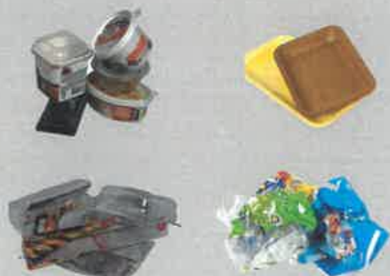
ORDURES MÉNAGÈRES, EMBALLAGES ET FILMS PLASTIQUES, BARQUETTES POLYSTYRENE, BOITE À ŒUFS, POT FROMAGE BLANC, SACHETS SURGELÉS.