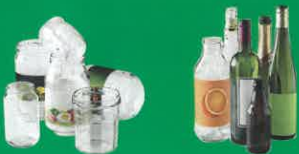
BOUTEILLES, POTS ET BOCAUX EN VERRE