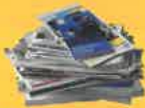
JOURNAUX, REVUES, MAGAZINES